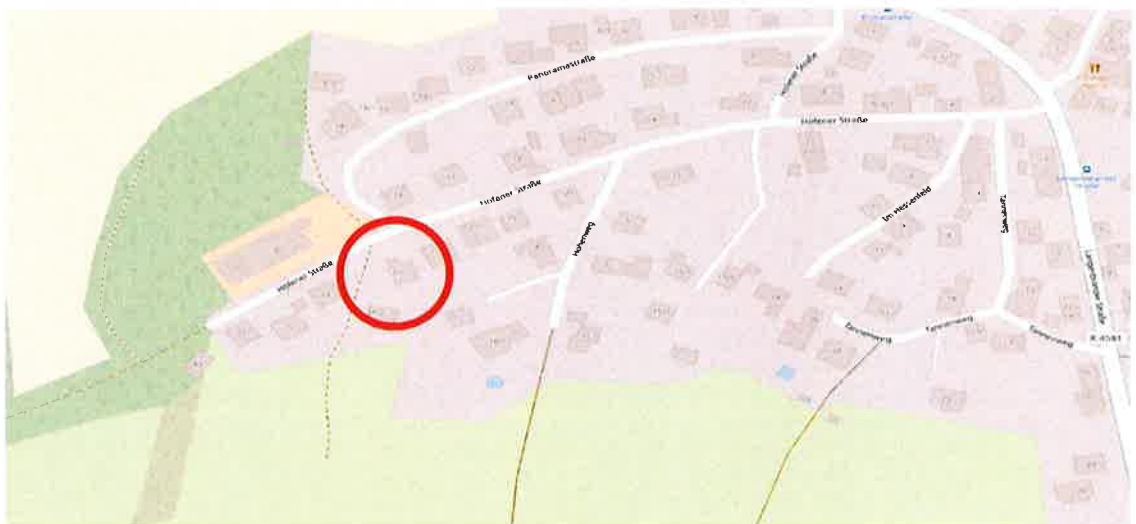
Abb. 2: Auszug OpenStreetMap